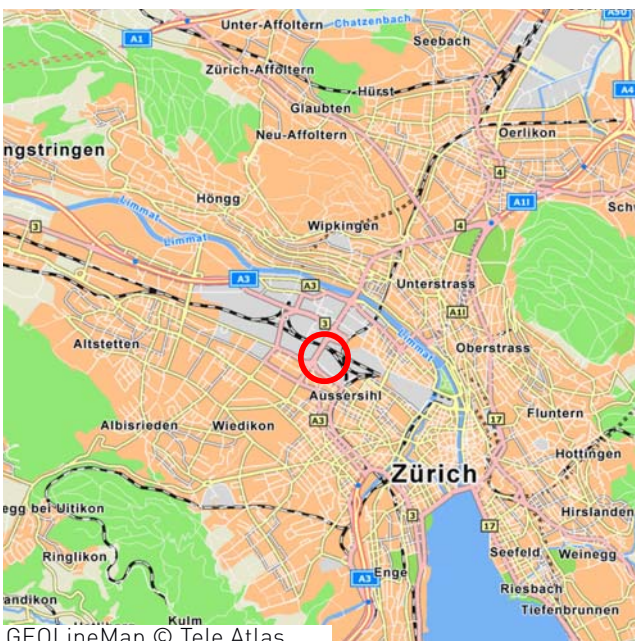
GEOLineMap © Tele Atlas