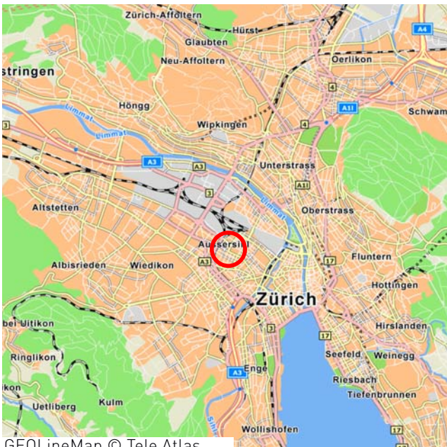
GEOLineMap © Tele Atlas