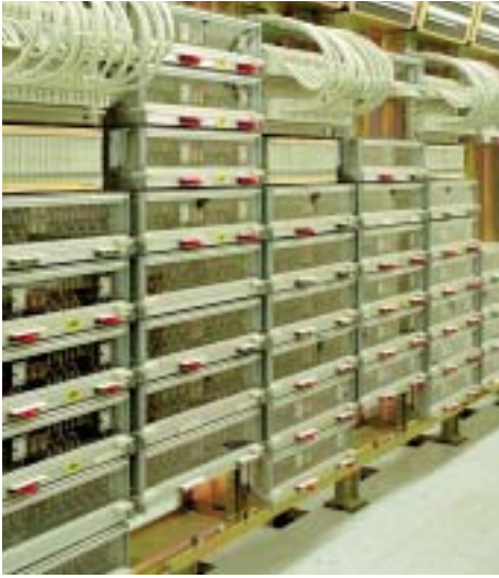
Remisierungsrechner für die Zugsbewegungen