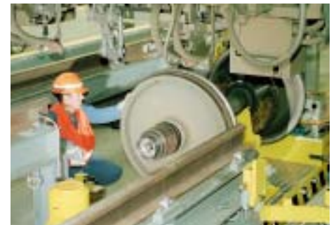
Radwechsel in der Unterhaltsanlage.

Die vier Arbeitsbühnen sind mit einem Selbstfahrantrieb sowie mit einer vertikal und horizontal verstellbaren Plattform ausgerüstet. Die Bühnen können entlang der Perronkanten fahren, wodurch Wartungs- und Inspektionsarbeiten an Schienenfahrzeugen in der ganzen Halle möglich sind.