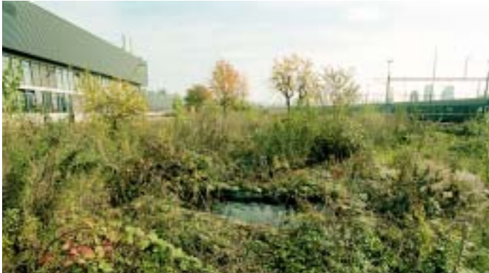
Vielfältige Spontanvegetation im Reservegebiet.