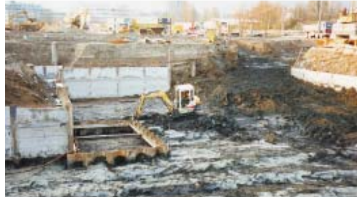
Kehrichtdeponien der Stadt Zürich und Lager von Altwaren- und Altpapierhändlern mussten entsorgt werden.