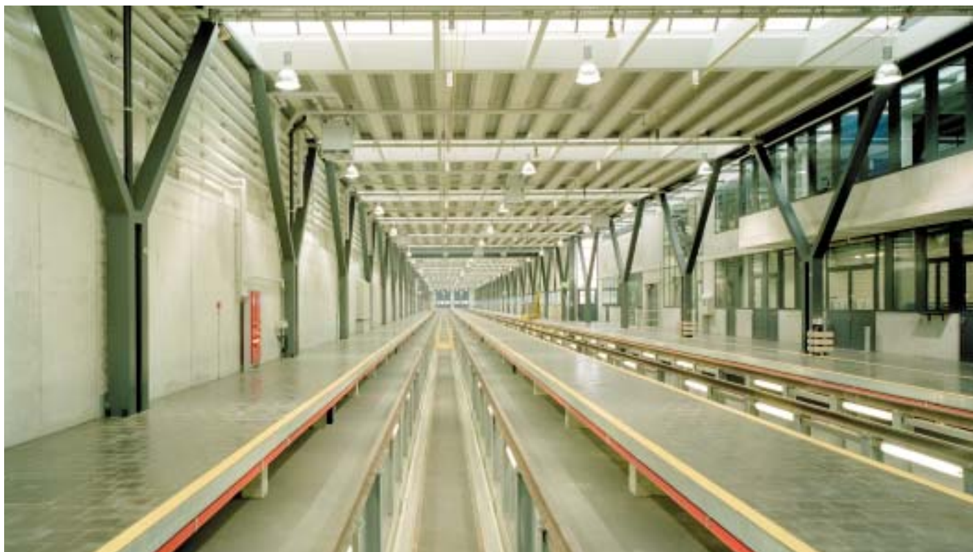
Die 250 m lange Unterhaltsanlage als Kernstück des Projektes.

Für die Reinigung und den Unterhalt der Doppelstock-Intercityzüge und der Hotelzüge benötigten die SBB eine Erweiterung der Unterhaltsanlagen. In dreijähriger Bauzeit entstand in Zürich-Herdern, zwischen Hard- und Europabrücke, kurz vor dem Bahnhof Zürich-Altstetten eine umfangreiche technische Anlage im Wert von 110 Millionen Franken. Sie umfasst: