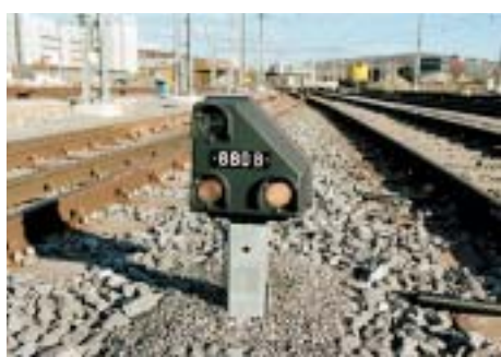
230 Zwergsignale sind Bestandteil der komplexen Infrastruktur

Spitzenlast im Gasnetz). 24-Stunden-Betrieb