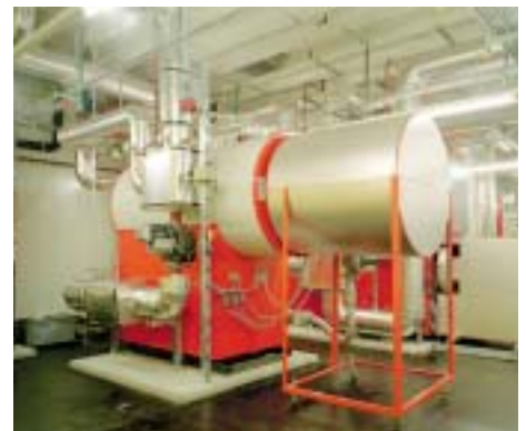
Blockheizkraftwerk für die Wärmeerzeugung

Für die Wärmeerzeugung sind ein Blockheizkraftwerk (BHKW), ein Gaskondensations- und ein Oelkessel installiert. Der Strom des mit Erdgas betriebenen BHKW wird für den Betrieb genutzt oder in das Stromnetz eingespeisen. Die anfallende Wärme dient der Raumheizung und der Warmwasseraufbereitung. In erster Priorität werden das BHKW und der Gaskessel betrieben. Der Oelkessel dient als Notkessel beim Ausfall des Gaskessels bzw. bei Abschaltung der Gasversorgung (bei