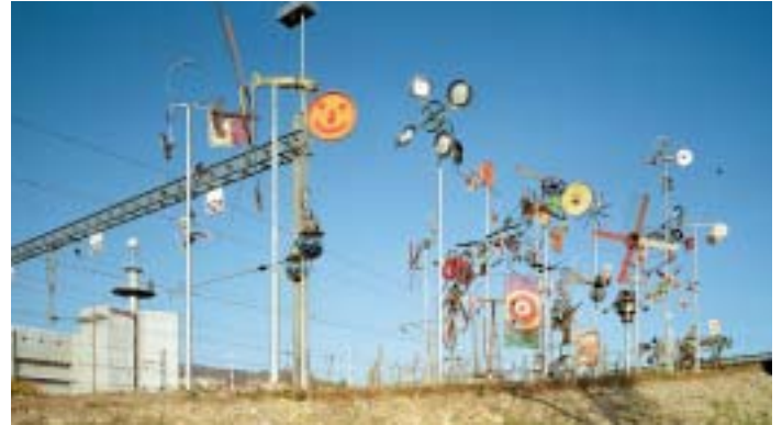
Die Altstetter Windspiele fanden einen attraktiven Standort